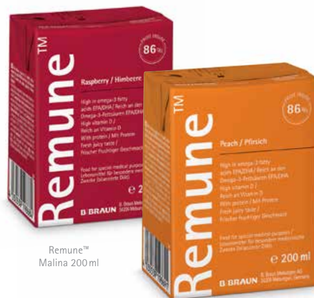
Remune™ Malina 200 ml

Vhodné pro děti starší 4 let, dospělé a seniory.